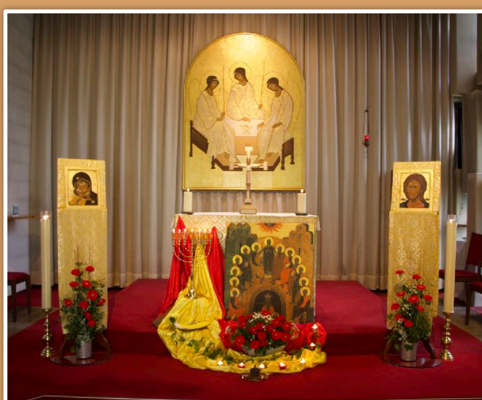
Unsere geschmückte Kappelle zu Pfingsten.

Letzten Samstag haben wir auch wieder unseren Medjugorje-Gebetsabend gehabt und erstmals wieder die Türen für Gottesdienstbesucher geöffnet. Natürlich müssen auch wir die Sicherheitsvorkehrungen für die Gottesdienste einhalten, die vom Erzbischof Paderborn vorgeschrieben wurden. Daher konnten leider nur 16 Personen kommen. Es war eine sehr intensive und erfüllte Gebetszeit, dank sei Gott!