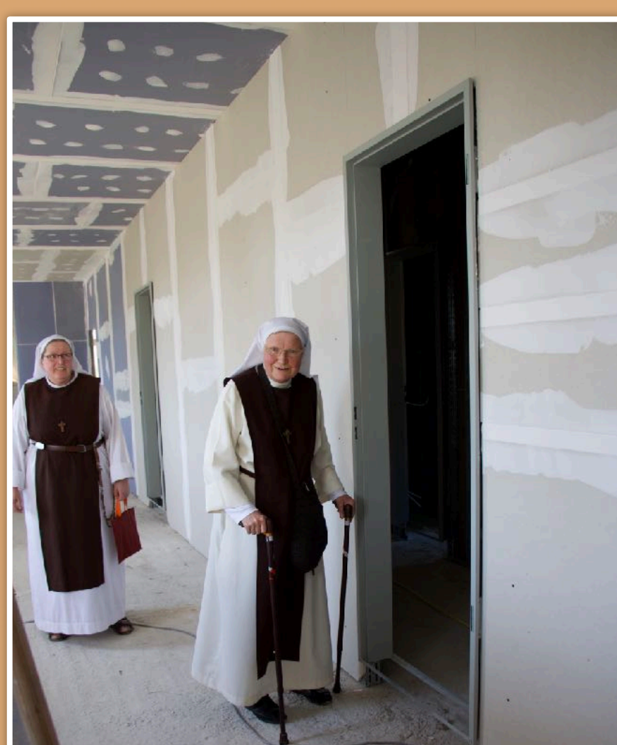
Auch bei den Schwestern sieht es schon recht gut aus...